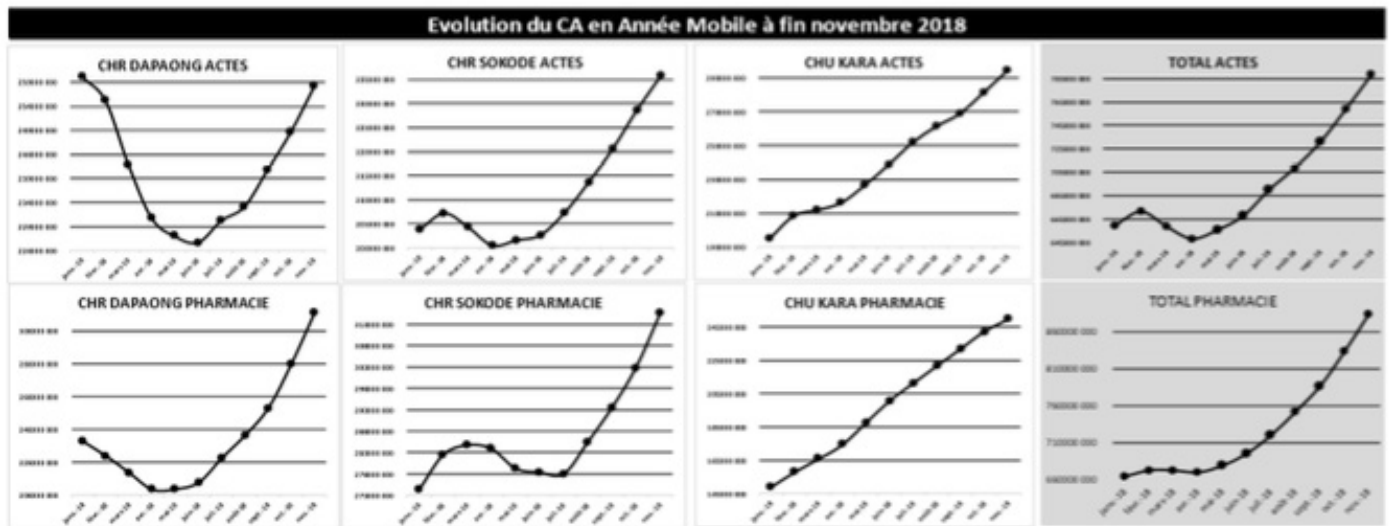
Figure 1 : Evolution du chiffre d'affaire en année mobile après 7 mois de contractualisation à Dapaong, Sokodé et Kara